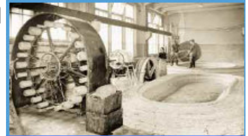
Produkcce kabelů 1930